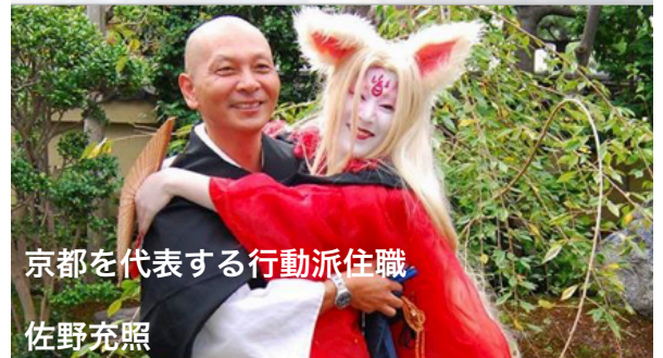
京都を代表する行動派住職